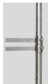
DETTAGLIO ZANCHE COD. EPP 02 - EPP 03