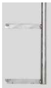
Zanche da cementare saldate fisse.

Materiale conforme al Regolamento (UE) N.305/2011.