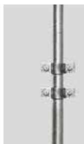
DETTAGLIO ZANCHE COD. EPP 01

Materiale conforme al Regolamento (UE) N.305/2011.