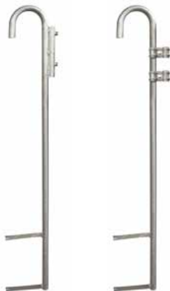
DETTAGLIO PALO COD. EPT 01 - EPT 02